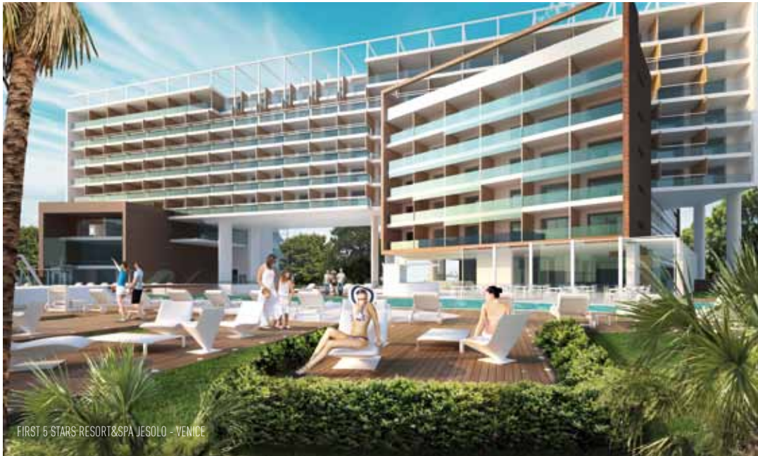
FIRST 5 STARS RESORT & SPA JESOLO - VENICE