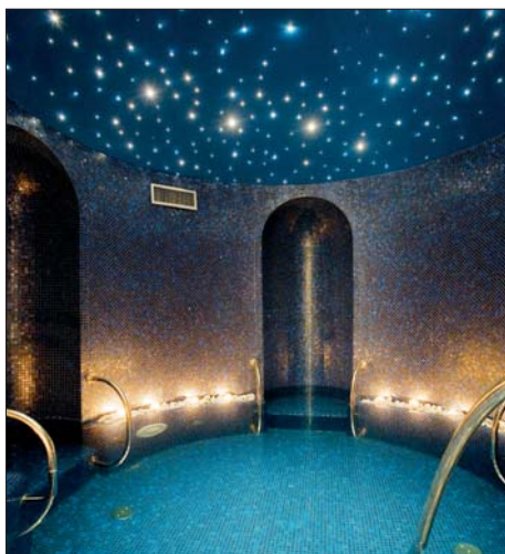
Sergio Bizzarro, Spa Hotel Belvedere, 2010 (ceramiche ceramics Floor-gres Globestone brown e and grey, mosaici mosaics Vetricolor e and Gemme di by Bisazza accessori accessories Inda e Colombo Design)