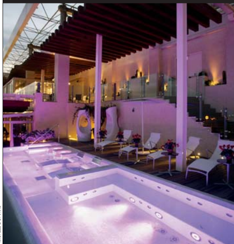
Sergio Bizzarro, Spa Hotel Romeo, Napoli, 2009 (mosaici piscina mosaics outdoors Florim Casa Dolce Casa colore color 01 bianco LUX, interni interiors ST Rubinetteria, sanitari bathroom fittings Flaminia, accessori accessories Colombo Design, lavabi washbasins Alapè