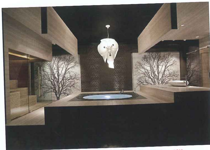
Aetherea Private Spa, Home & Spa Design, Fuorisalone 2011

in different typologies decorated in hi-tech modern style, there is room for a small but precious Spa that houses a sauna, Turkish bath, massage parlour and a delicious herbal tea room for the spiritual and physical wellbeing of its guests. As it says in the internet page dedicated to the Studio Bizzarro & Partners, he is convinced of the necessity for "involving people to offer a memorable experience in every situation exceeding all expectations". He has designed many projects for resorts,