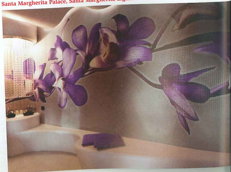
Santa Margherita Palace, Santa Margherita Ligure