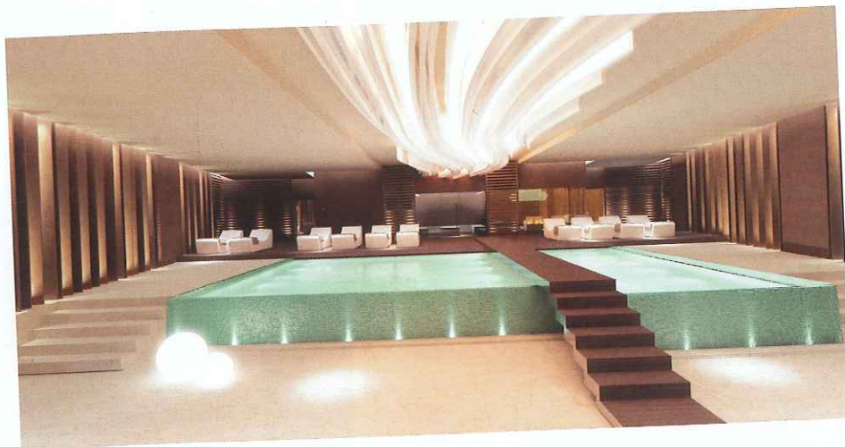
Hotel Frontemar, Jesolo

One step from feeling like to be in heaven